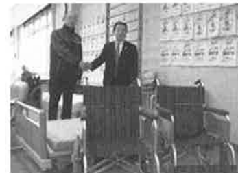
トヨタカローラ青森(株)