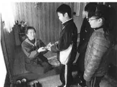
ほのぼのコミュニティ21推進事業