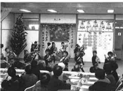
通所介護事業 小泊保育所慰問訪問