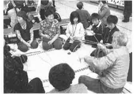
高齢者交流事業 ドッグ引き