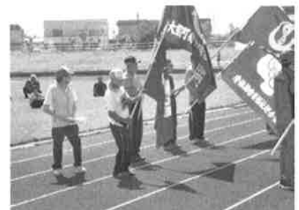
青森県障害者スポーツ大会