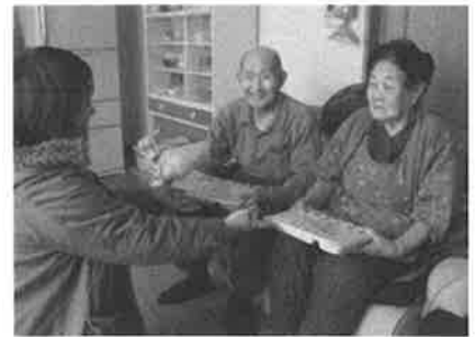
配食サービス事業