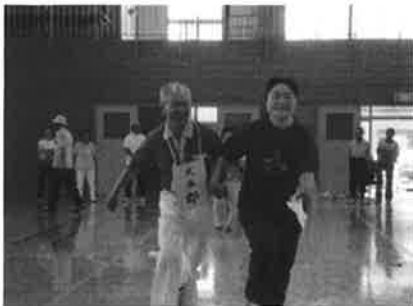
北郡老人クラブ連合会 スポーツ交流会