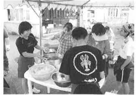
ボランティア推進校事業 小泊中学校ボランティア