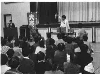
高齢者の生きがいと健康づくり事業