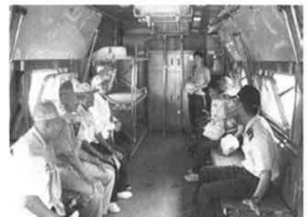
北つがる地区療育キャンプ 「愛の輪レクリエーション」