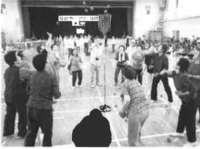
北郡老人クラブ連合会 スポーツ・芸能交流会