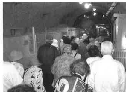
高齢者交流事業「ふれあいの集い」 青函トンネルの見学