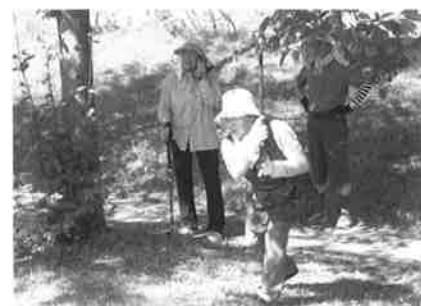
いきいきグラウンドゴルフ 北郡選手権大会