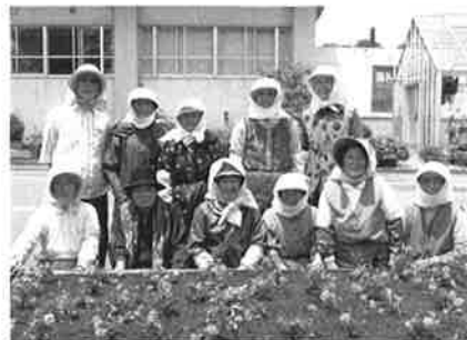
ボランティア連絡協議会 町老連中里支部女性部の皆さん