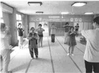
高齢者ねたきり防止事業