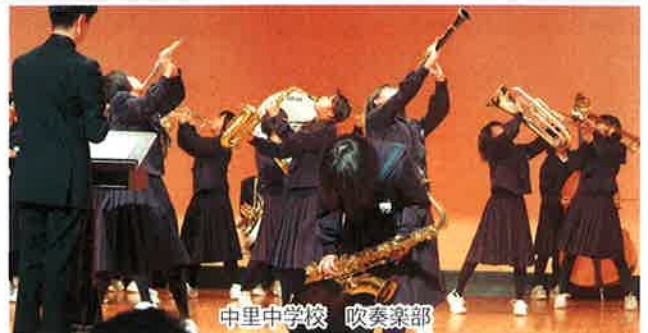
中里中学校 吹奏楽部