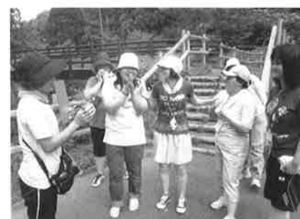
北つがる地区療育キャンプ 「愛の輪レクリエーション」