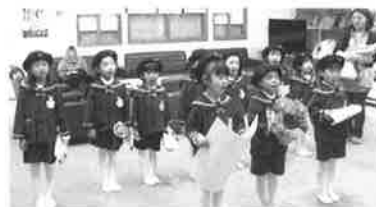
中里幼稚園父母の会