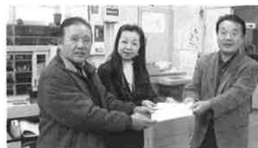
中泊町商工会女性部 中泊町商工会工業部会