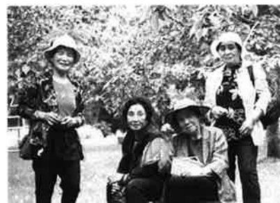
高齢者交流事業 中里地域「ふれあいの集い」