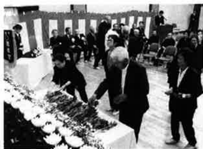
中泊町遺族会 戦没者追悼式・慰霊祭