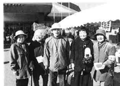
共同募金運動 「高齢者奉仕クラブ」による街頭募金