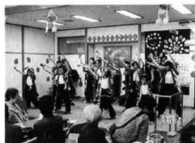
通所介護事業 社協夏祭り「夕涼み会」