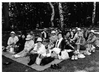
高齢者の生きがいと健康づくり事業 宝寿大学 バス遠足