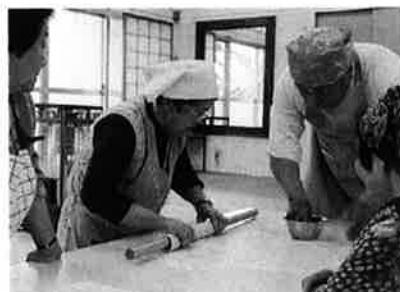
高齢者寝たきり防止事業 「蕎麦づくり体験」