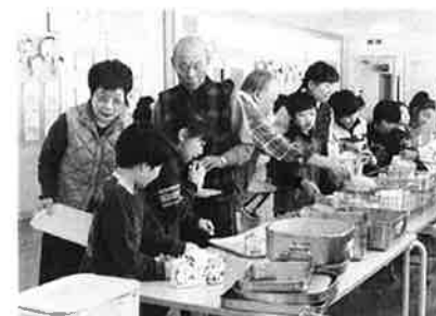
「駅ナカ学校」 小泊小学校2年生と交流会