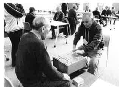
県・郡社会福祉協議会事業 「いきいき囲碁・将棋・ゴニカン大会」