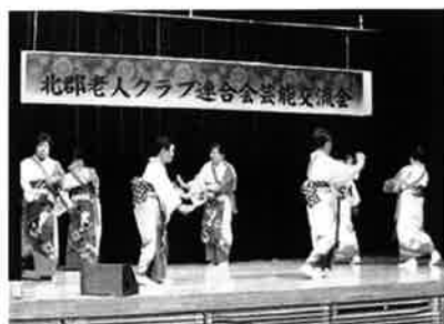
北郡老人クラブ連合会 スポーツ・芸能交流会