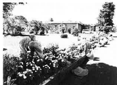
ボランティア連絡協議会 「町老連中里支部女性部」による花苗の植え付け