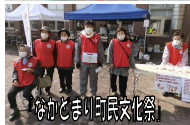
なかとまり町民文化祭