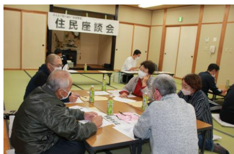
地域連携ネットワーク構築事業 【地域貢献活動連絡協議会(社協)】

10月25日から、中泊町内5地区を対象に、住民座談会を開催いたしました。住民座談会では、住民の皆さんが安心して住み続けられる地域づくりのために、地域のよいところや困りごと、これからの生活に改善が必要な問題点などを話し合いました。